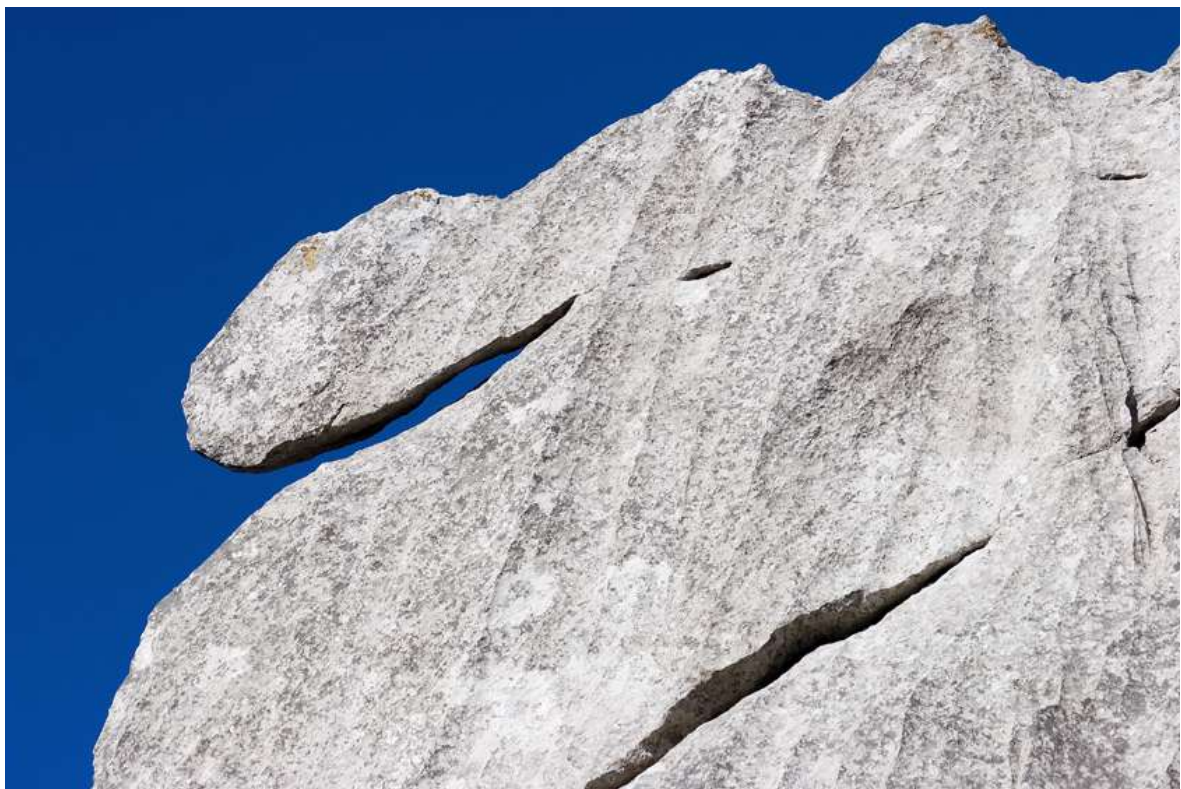
Slika 6. Zanimljiv detalj sa staze