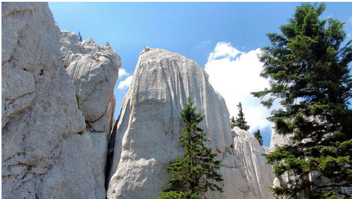
Slika 3. Detalj sa staze