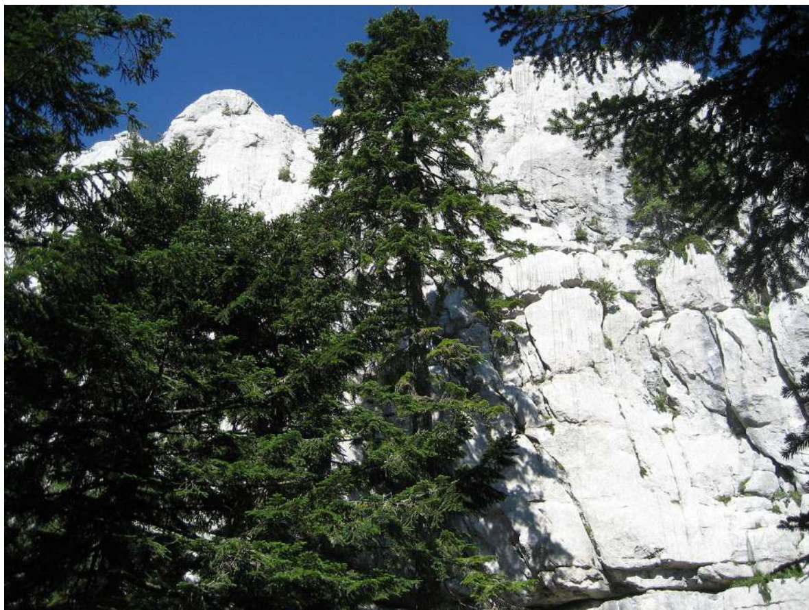
Slika 4. Detalj sa staze