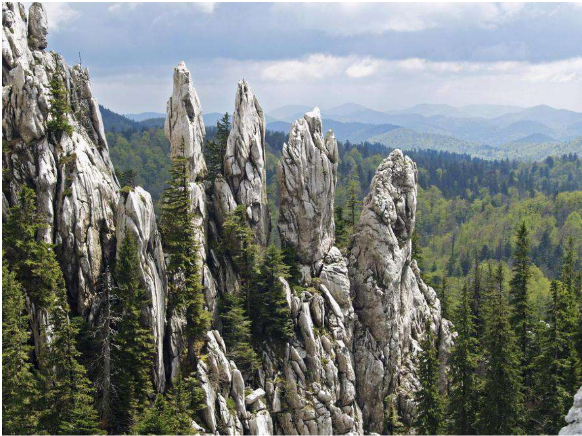
Slika 5. Prsti