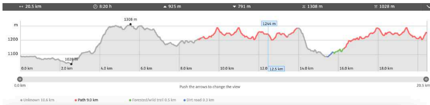
Slika 2. Detalji rute