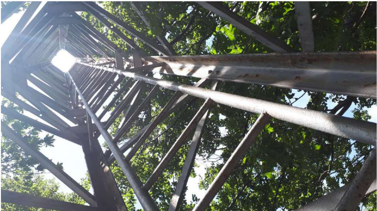
Željezna razgledna piramida visine 11m