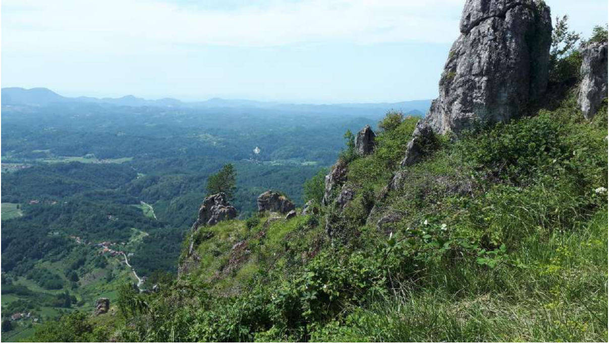
Vidikovac blizu Filićevog doma s pogledom na dvorac Trakošćan u daljini